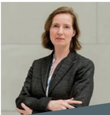
Manja Korbella Sponsoring und Kooperationen

Bundesverband der Deutschen Industrie e.V. Breite Straße 29 10178 Berlin T.: +49 30 2028-0 www.bdi.eu